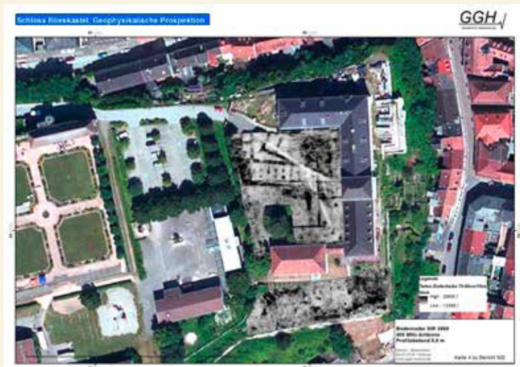
2 Geoprospektion 2016: Das Bodenradar zeigte Baubefunde vom Schloss und der Burg Blieskastel, die heute unter dem Rasen des Schulhofs liegen. Tiefenscheibe 70-90 cm, projiziert auf das Luftbild des Schlossbergs, Quelle: C. Hübner, GGH GmbH / World Imagery Sources: Esri, DigitalGlobe, GeoEye, i-cubed, USDA FSA, USGS, AEX, Getmapping, Aerogrid, IGN, IGP, swisstopo, and the GIS User Community

tete man dort einen Schutzbau mit Wohnhaus und ab den 1950er Jahren folgten mehrere Schulgebäude. Außer der Orangerie des Schlosses sind im Wesentlichen nur noch solche historischen Mauern oberirdisch erhalten, die Flächen auf unterschiedlichem Niveau gegeneinander abgrenzen. Hierzu zählt auch die Futtermauer, die den Felsporn des Schlossbergs rundum gegen die Besiedlung an seinem Fuße abgrenzt.